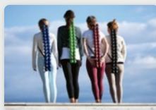
Livré avec une sangle de transport