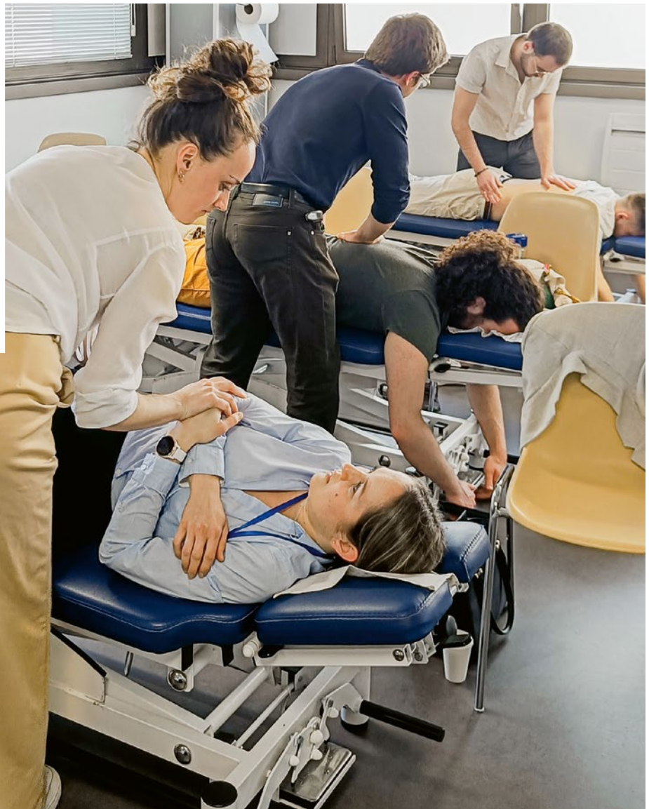
Formation continue pratique.