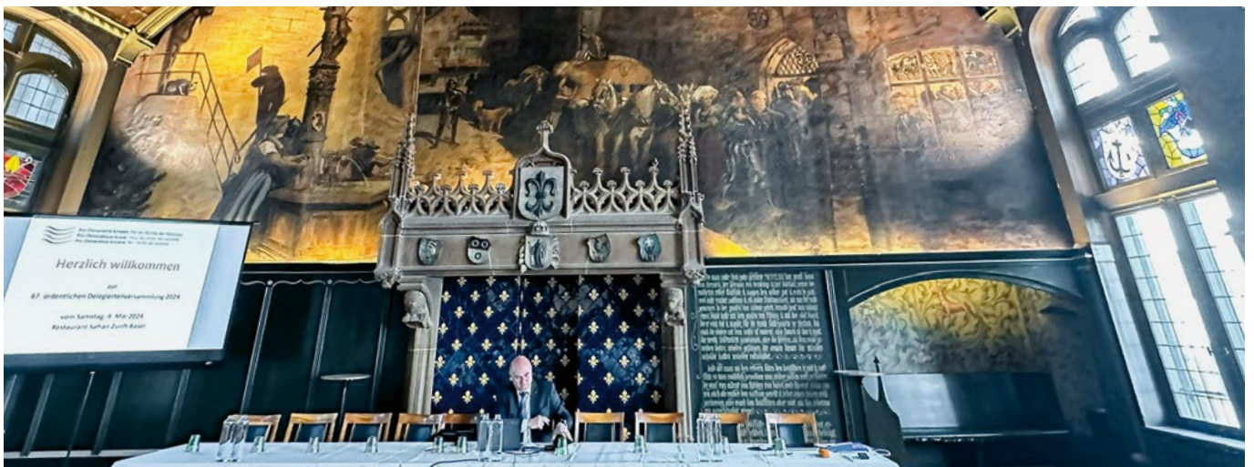
La solitude du président central Rainer Lüscher n'a pas duré longtemps...