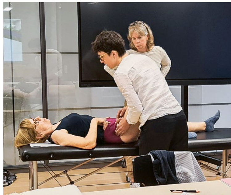
Préparation aux examens pour les futurs chiropraticiens et chiropraticiennes.

L'objectif du stage en milieu hospitalier, ou du stage dans un cabinet de groupe, consiste à promouvoir la collaboration interdisciplinaire et à tisser des liens pour la suite des activités professionnelles. Les institutions qui veulent proposer des places de formation de ce type pour les chiropraticiens sont contrôlés préalablement par l'académie.