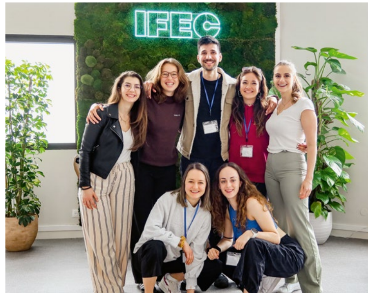
L'équipe suisse à Paris.