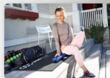
Multiples possibilités d'utilisation